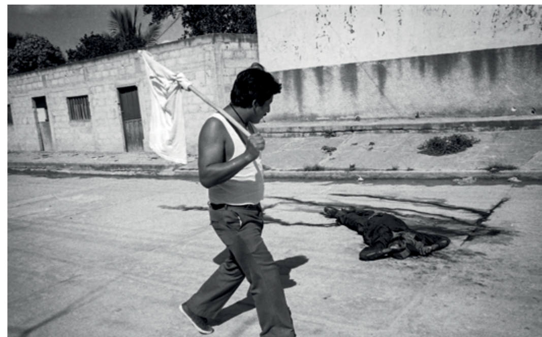
● Integrantes del EZLN muertos en enfrentamientos con el Ejército mexicano en Ocosingo, Chiapas.

El texto, como se indicó, propone enmarcar estas discusiones en relación con las ejecuciones arbitrarias. Serán planteados dos contextos: por un lado, la lucha armada entre el Ejército Zapatista