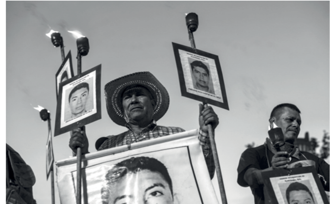
● Ciudad de México, 26 de abril de 2016.- Organizaciones sociales, estudiantiles y campesinas acompañaron a los familiares de los 43 estudiantes desaparecidos de Ayotzinapa para exigir justicia a 19 meses de su desaparición y asesinato el 26 de septiembre de 2014 en Iguala, Guerrero.

de la desaparición de los 43 normalistas y sometido a una brutal tortura que terminó con su vida. 34 Este caso ejemplifica las denuncias de brutal tortura por parte de policías o marinos que participaron en las detenciones vinculadas con el caso Ayotzinapa.