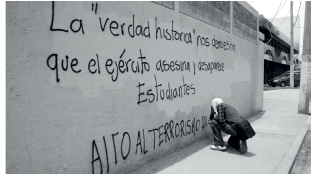
● Chilpancingo, Guerrero, 26 de abril de 2016.- Estudiantes de la Normal de Ayotzinapa y de normales públicas del interior del país, acompañados de los padres de los 43 desaparecidos en Iguala, marcharon del monumento al general Nicolás Bravo Rueda hacia el punto conocido como Parador del Marqués, donde realizaron un mitin para exigir la presentación con vida de los 43 estudiantes y presionar a que integrantes del Grupo Interdisciplinario de Expertos Independientes (GIEI) continúe la investigación para esclarecer su paradero.