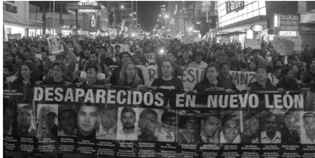
Monterrey, Nuevo León, 1 de Diciembre de 2014.- Alrededor de 1,000 personas marcharon por calles del centro de la ciudad en protesta por los 43 estudiantes normalistas desaparecidos en Iguala. El contingente salió de la Procuraduría General de Justicia hacia la plaza de Colegio Civil.

internacional humanitario a interponer recursos y obtener reparaciones, de 2006, 14 señala que los derechos de las víctimas se dividen en tres “bloques”: 1) acceso igual y efectivo a la justicia; 2) reparación adecuada, efectiva y rápida del daño sufrido y 3) acceso a información pertinente sobre las violaciones y los mecanismos de reparación.