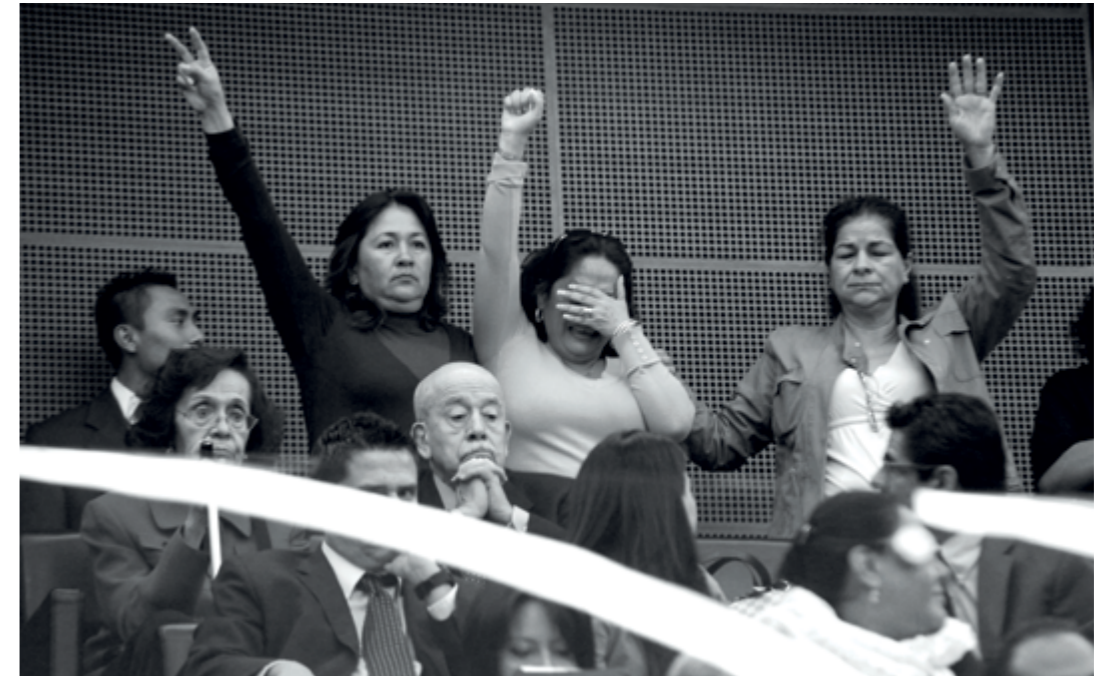
📍 Ciudad de México, 11 de julio de 2012.- Integrantes del Movimiento por la Paz con Justicia y Dignidad se manifiestan en la sesión de la Comisión Permanente del Congreso de la Unión, durante la discusión y aprobación de regresar las observaciones que el presidente Calderón hizo al decreto de la Ley General de Víctimas, debido a que se hicieron en forma extemporánea.

Los momentos de justicia transicional que se detonaron en América Latina a finales de los años ochenta y principios de los noventa del siglo xx inspiraron expectativas en México que continuaron cuando sucedió la alternancia de partidos en el poder. En los albores del nuevo milenio, la administración entrante (perteneciente al Partido de Acción Nacional, PAN, por primera vez un partido distinto al Partido Revolucionario Institucional, PRI) prometió responder a las demandas de investigación y justicia de los hechos del pasado, con lo que se creía que daba