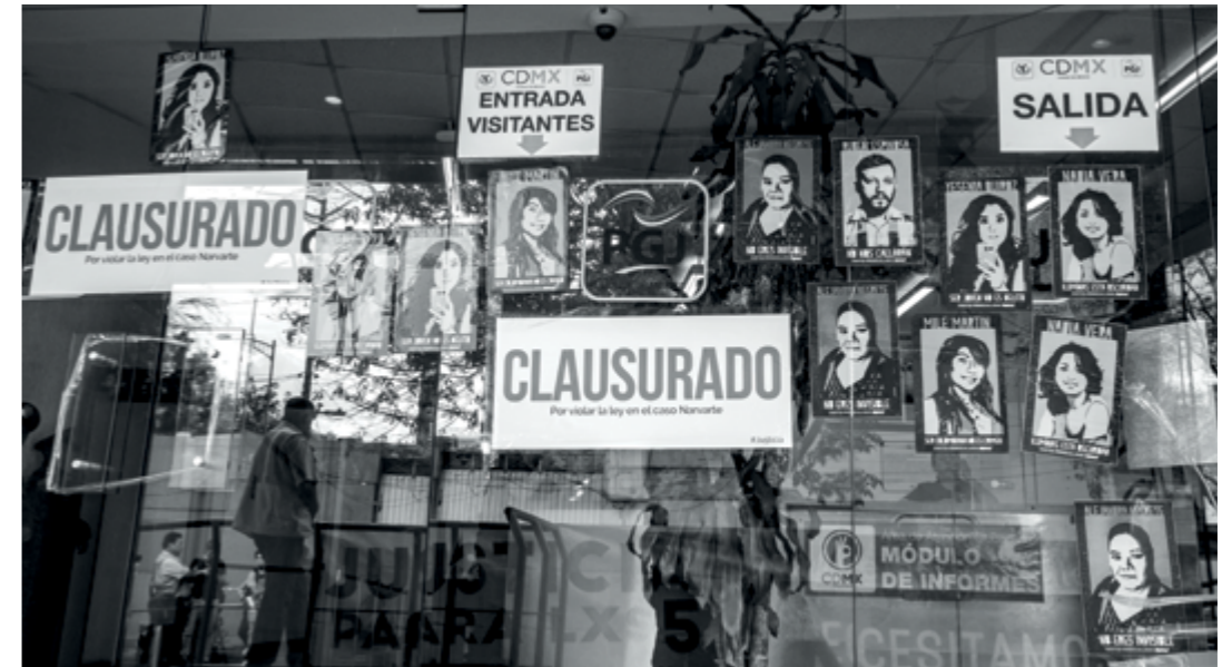
📍 Familiares de las víctimas del caso Narvarte se manifestaron afuera de la Procuraduría General de Justicia (PGJ) de la Ciudad de México.

49. Asimismo, que sopesa y valore las pruebas recabadas hasta ahora en clave con aquella línea, en particular las mecánicas de hechos y lesiones. Desde esta perspectiva, posiblemente, dejaría de ser gratuito que, así como Mile, Rubén y Nadia hayan sido objeto de particular saña.