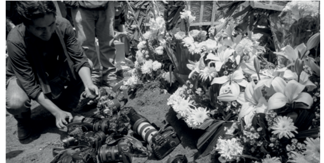
Ⓜ Familiares, amigos, compañeros y colegas asistieron al entierro del fotoperiodista Rubén Espinosa, quien colaboraba para la agencia Cuartoscuro, la revista Proceso y AvC .