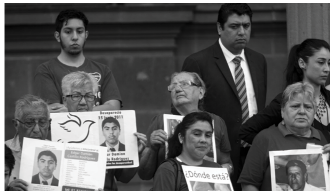
Monterrey, Nuevo León, 25 mayo 2016.- Ciudadanos en Apoyo a los Derechos Humanos, A.C. (CADHAC) se unió a la conmemoración de la Semana Internacional del Detenido Desaparecido que hace más de tres décadas fue instituida en América Latina. Cadhac y alumnos de la Facultad de Artes Visuales de la UANL develaron retratos de familiares de desaparecidos en el estado en las afueras del Palacio de Gobierno. Desde el 2009 hasta hoy, se tiene un registro de 1,353 personas desaparecidas, de las cuales han sido localizadas 155 (86 mediante perfiles genéticos y 69 con vida).

Con esta dinámica, comenzamos preguntando lo que ha significado la búsqueda del ser querido. La respuesta que dieron las familias de las víctimas es que para ellos esta búsqueda significa soledad. Soledad porque, si bien existe un reconocimiento claro de que la búsqueda no debe hacerse por una sola persona, sea la madre, el padre o la pareja, sino que ha de hacerse con el acompañamiento de otros integrantes de la familia o personas solidarias, así como con la acción clara y profesional de las autoridades, la realidad es que, en casi todos los inicios, caminar a la búsqueda de un ser querido ha estado marcado por la soledad.