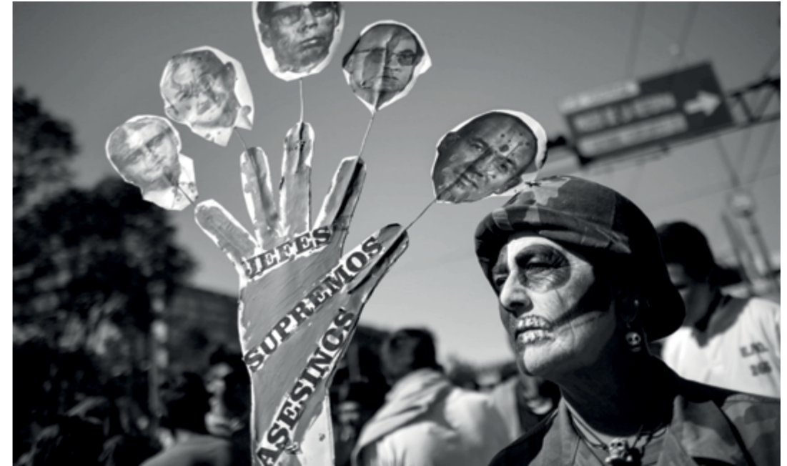
● Marcha de la Plaza de las Tres Culturas, de Tlatelolco al Zócalo capitalino, en el 27 aniversario de la masacre estudiantil del 2 de octubre de 1968. Participaron exlíderes estudiantiles agrupados en el Comité del 68, los padres de los 43 normalistas desaparecidos de Ayotzinapa, organizaciones sociales y estudiantiles.

Así, para describir la manera en que la sociedad civil mexicana ha entendido el derecho a la verdad y cómo, a través de su práctica, la ha dotado de significado en un contexto histórico específico, el capítulo