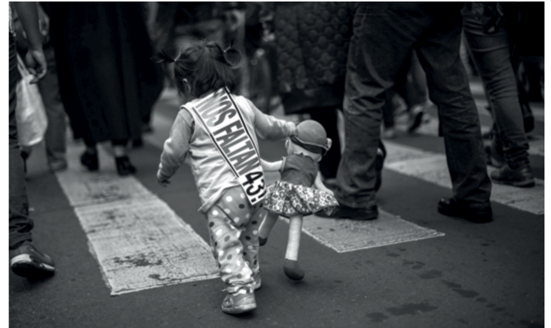
● Ciudad de México, 26 de abril de 2016.- Organizaciones sociales, estudiantiles y campesinas acompañaron a los familiares de los 43 estudiantes desaparecidos de Ayotzinapa, para exigir justicia a 19 meses de su desaparición y asesinato, el 26 de septiembre, en Iguala, Guerrero.

Luego, a partir de ello, exigir —en el caso