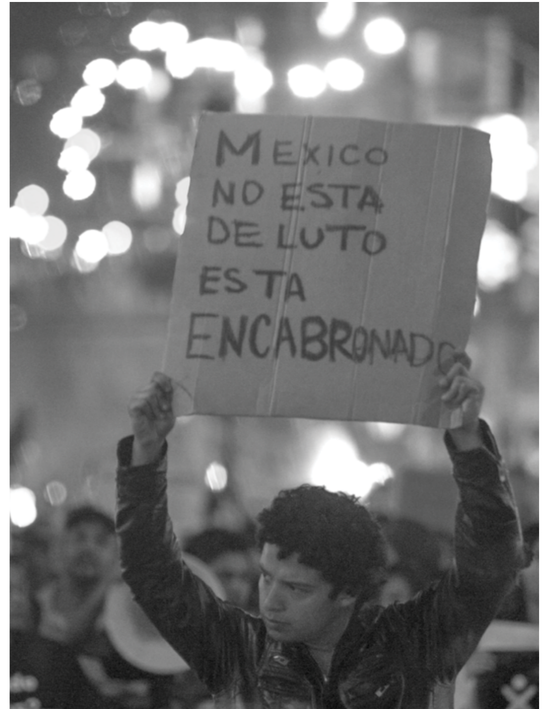
● Monterrey, Nuevo León, 1 de diciembre de 2014.- Alredor de mil personas marcharon por calles del centro de la ciudad en protesta por los 43 estudiantes normalistas desaparecidos en Iguala. El contingente salió desde la Procuraduría General de Justicia hacia la plaza de Colegio Civil.

En otras palabras, es imprescindible seguir señalando prácticas de negación y opacidad en las agencias de gobierno y denunciando deudas individuales concretas. Sin embargo, hay que fortalecer la exigencia y contribuir a la creación de mecanismos que permitan la construcción de la verdad desde una mirada colectiva. Éste quizá sea uno de los retos más importantes tanto del Estado y sus distintas agencias, como de la sociedad en general, organizada, colectiva y de sus individuos.