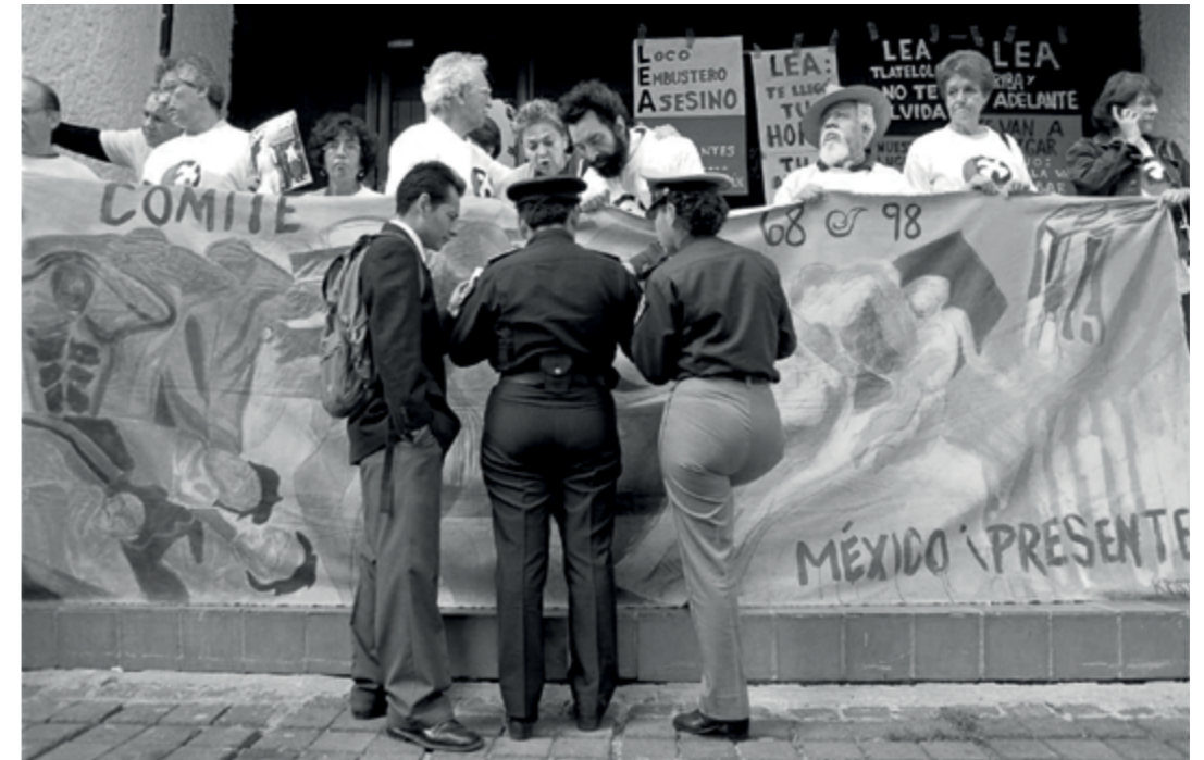
Integrantes del Comité 68-98 a las afueras de la Fiscalía Especial para Movimientos Sociales y Políticos del Pasado de la PGR, donde se presentó a declarar el ex presidente y ex secretario de Gobernación Luis Echeverría Álvarez.