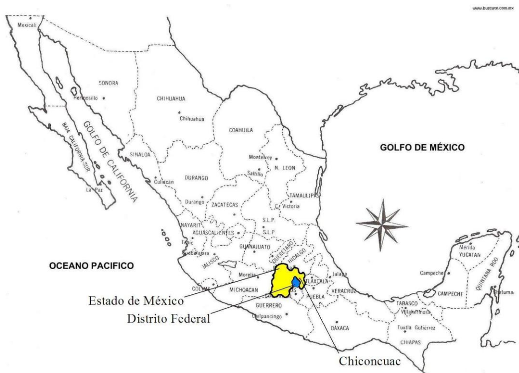
Mapa de la República Mexicana, indicando al estado de México y en su interior, el municipio de Chiconcuac, lugar donde se realizó la investigación.